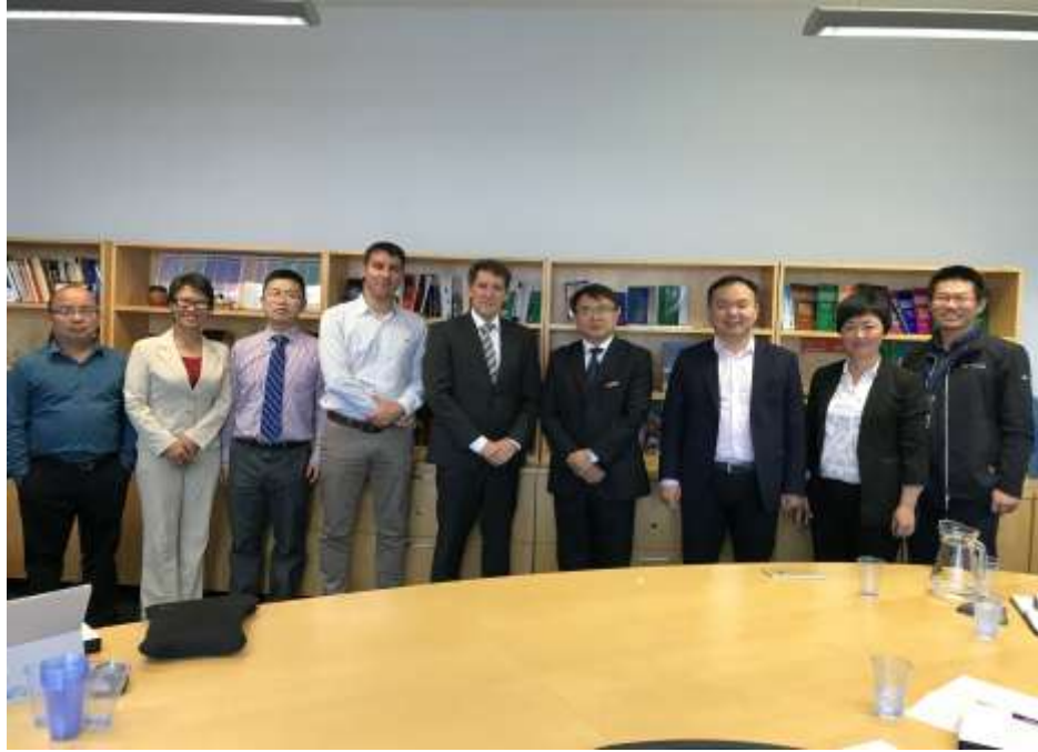
与诺森比亚大学法商学部领导交流合影