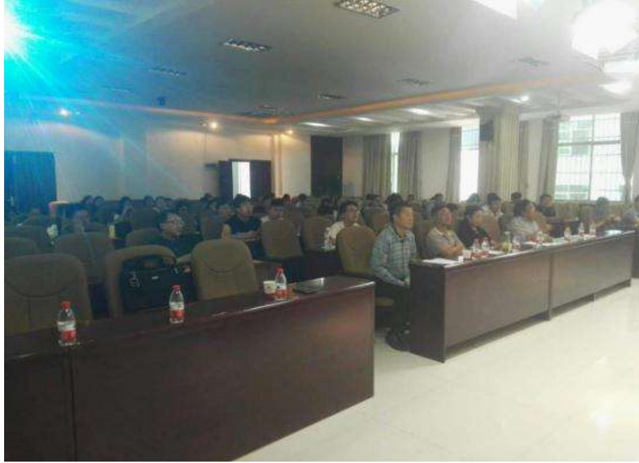
参会人员聚精会神的听交流报告